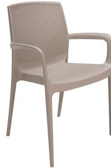
BÖH.MEN AL Armlehnstuhl